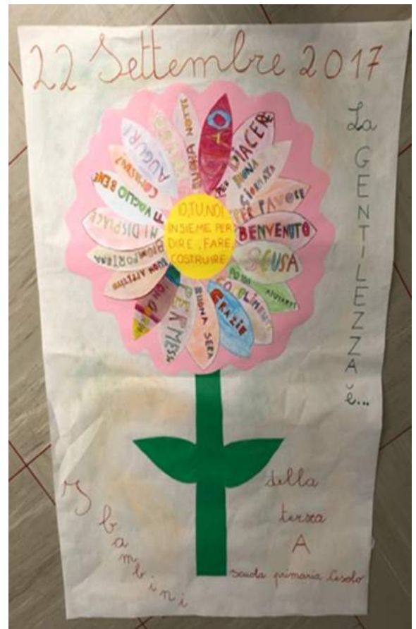
Progetto Accoglienza classi 3 e A e B